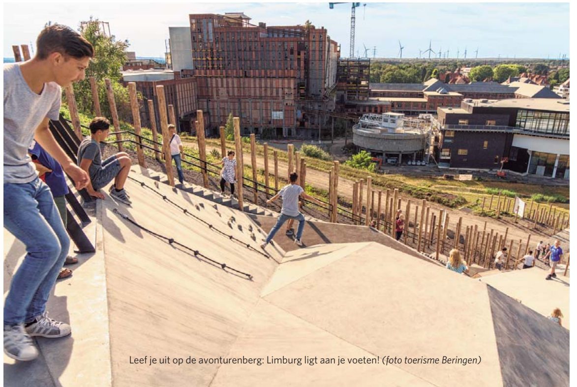
Leef je uit op de avonturenberg: Limburg ligt aan je voeten!

door snorkel- en duikcentrum TODI. In dit onderwaterparadijs snorkel of duik je tussen tropische zoetwatervisjes naar de verrassende decorelementen op de bodem. Een beleving die zijn gelijke niet kent in Europa. Wie liever droge voeten wil bewaren kan via de Aquarium View genieten van dit spektakel. Wees niet verrast als je plots een zeemeermin ziet passeren.